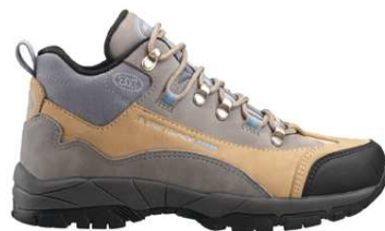
Chaussures Marche Nordique